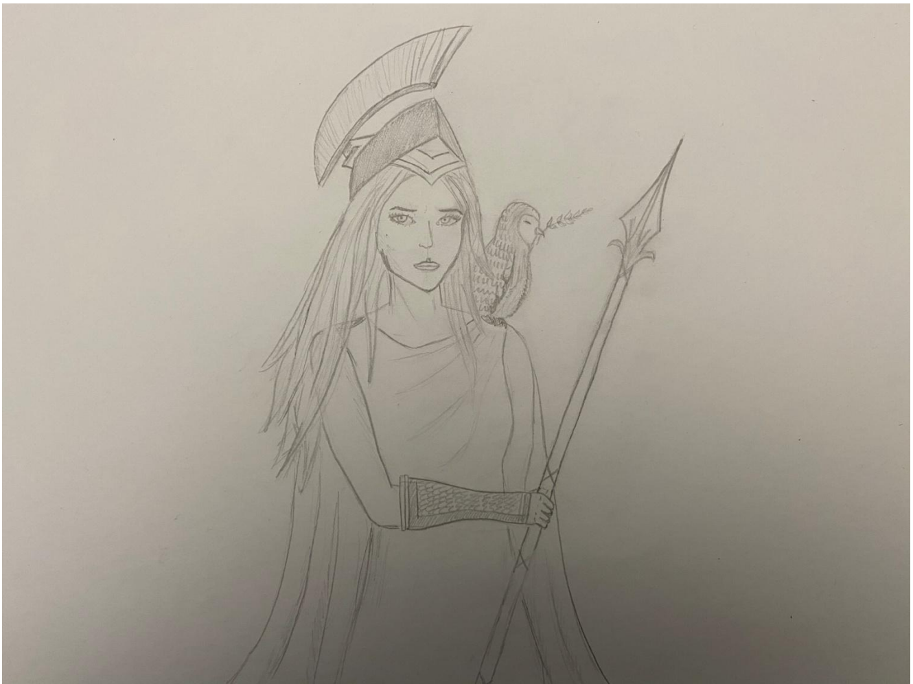
Zuzana Lhotová 3.A / Pallas Athéna