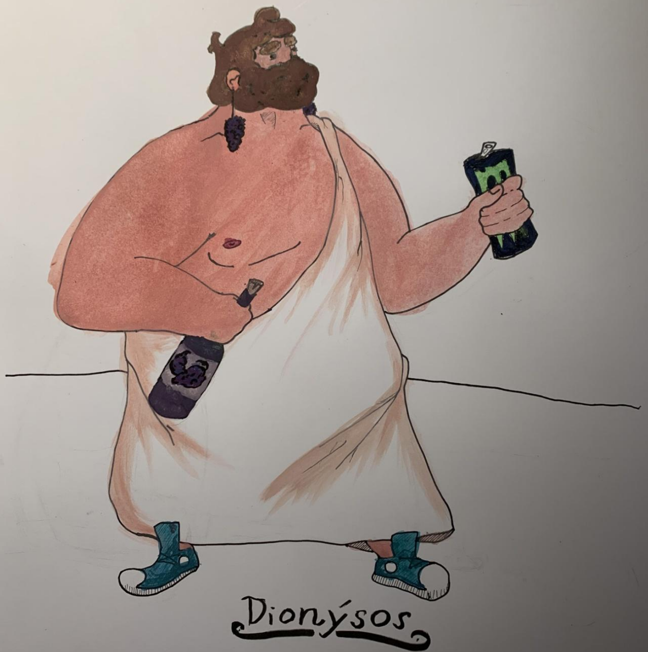
Dimitrij Jarčenko 3.A / Dionýsos